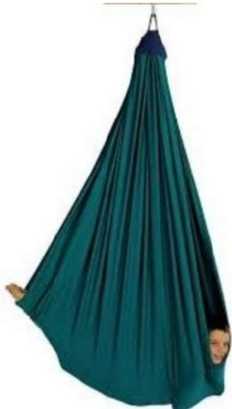
COLUMPIO CABESTRILLO GRANDE