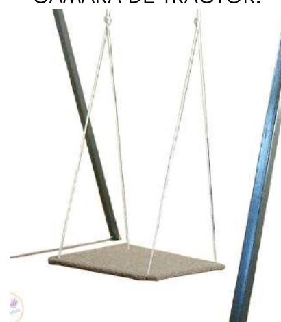
COLUMPIO VESTIBULAR CUADRADO 2 EJES