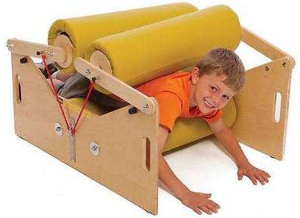
EXPRIMIDOR PROPIOCEPTIVO DOBLE