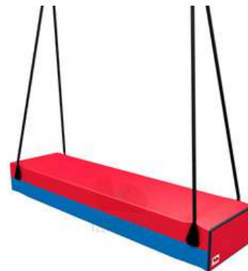
COLUMPIO BARRA COLGANTE. 1.00 X 20 CMS