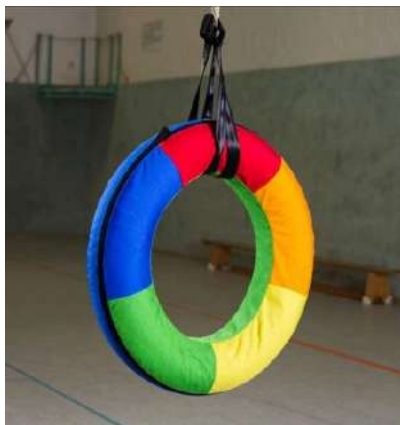
DONA 80X60 DIAMETRO INTERNO