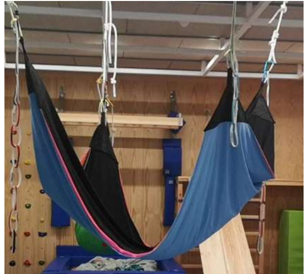
HAMACA EN LYCRA PARA SUSPENSIÓN 4 EJES