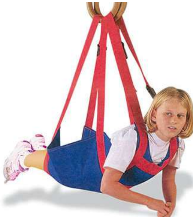
ARNÉS DE CUERPO. COLUMPIO DE SUSPENSION