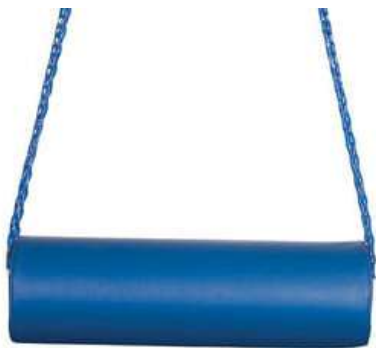
COLUMPIO VESTIBULAR. RODILLO 1.00 X 25 CMS COLGANTE