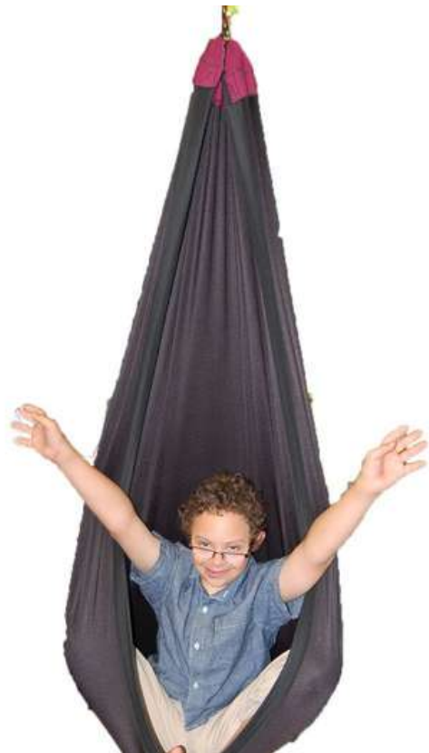
HAMACA CAPULLO ABIERTA