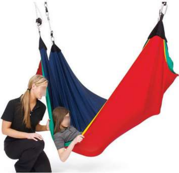
HAMACA EN LYCRA PARA SUSPENSIÓN 2 EJES