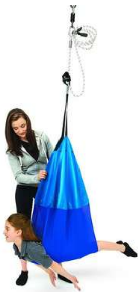
COLUMPIO CABESTRILLO CHICO