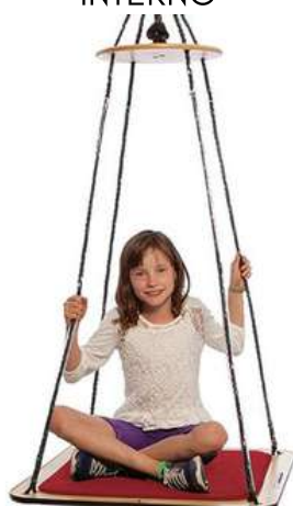
COLUMPIO VESTIBULAR CUADRADO 4 EJES