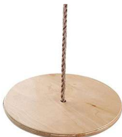
COLUMPIO VESTIBULAR REDONDO