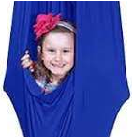
HAMACA CAPULLO CERRADA