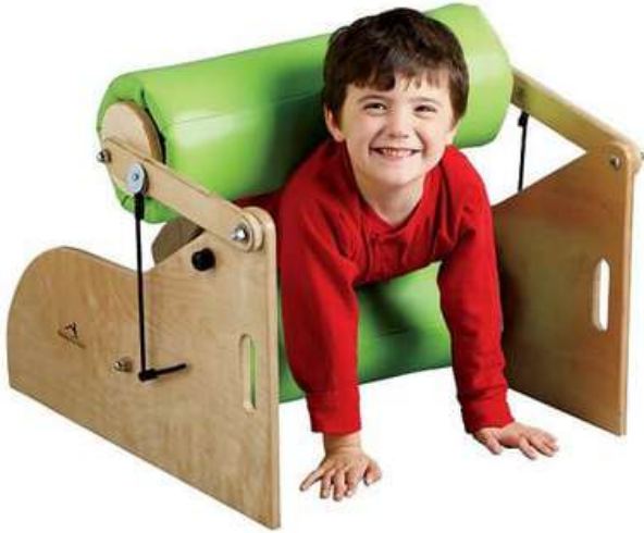
EXPRIMIDOR PROPIOCEPTIVO SENCILLO