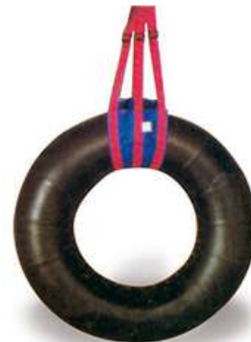
COLUMPIO VESTIBULAR DE CAMARA DE TRACTOR.